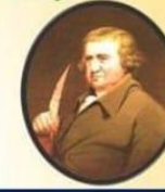
290 th Birth Celebration of Erasmus Darwin